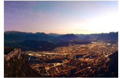
Grenoble de nuit.

L'entreprise grenobloise Skaping conçoit, quant à elle, des caméras numériques extérieures (webcams). Spécialisées dans les photos et vidéos de paysages, elles communiquent ces images aux médias grâce à l'interface multi-plateforme de l'entreprise.