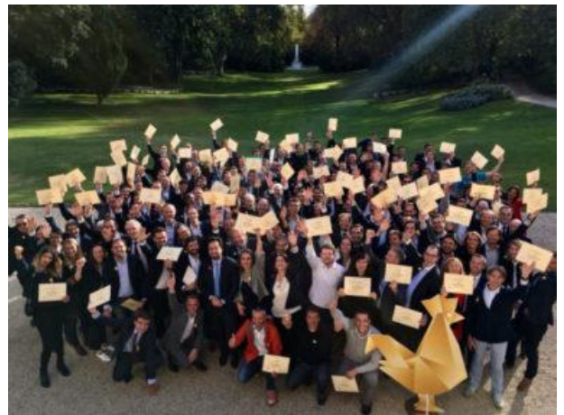
Les 107 lauréats de la promotion 2017-2018 du Pass French Tech dans les jardins de l'Élysée, septembre 2018.

Les trois entreprises ont donc rejoint Aledia , Koelis , Wizbij , Short Édition , Une Petite Mousse , et Mhikes (toutes iséroises) dans le palmarès régional du Pass French Tech. Qui compte ainsi désormais neuf entreprises.