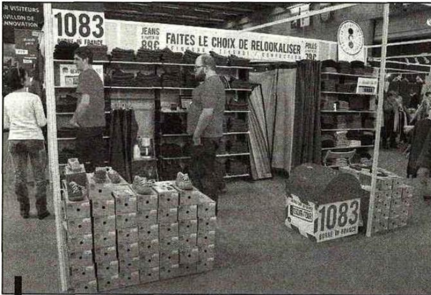
En tant qu'indépendant, le fabricant de jeans 1083, était le premier drômois à participer au salon MIF l'an dernier.

Au total, la région Rhône Alpes était bien représentée avec 72 entreprises revendiquant le Made In France, venues de l'Ain, de l'Ardèche, de la Drôme, de l'Isère, du Rhône, de Savoie et de Haute Savoie. Seul, le département de la Loire n'était pas représenté.