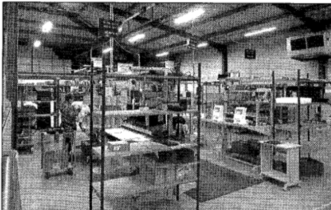
Si la fabrication des différents éléments qui constituent une borne est sous-traitée, IPM France dispose toutefois de son propre atelier d'assemblage et de test.

démarches du citoyen en mairie et augmenter l'efficacité de la collectivité en favorisant l'autonomie de l'utilisateur et en diminuant le temps d'attente aux guichets d'accueil. La borne interactive d'IPM France permet la navigation sur le site internet de la ville, sur des sites partenaires choisis par la collectivité (tourisme, petite enfance, loisirs...) ainsi que sur le site du "Référéndum d'initiative partagée" (elle répond ainsi à l'obligation légale formulée par la loi organique du 6 décembre 2013). Elle peut également proposer la consultation d'informations concernant l'affichage légal et l'accès au portail citoyen, portail famille et à un questionnaire de satisfaction usager.