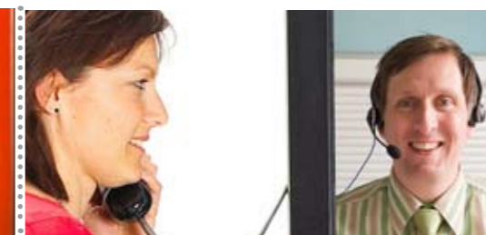
Service et Accueil