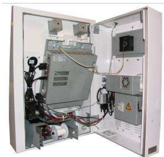
Intérieur de la EK 6000® Murale