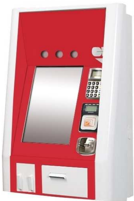
Borne interactive EK 6000® Murale de paiement et rechargement